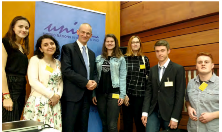
Plenárny večer za účasti hostí, partnerov a spoluorganizátorov spojený s diskusiou a vyhlásením postupujúcich finalistov