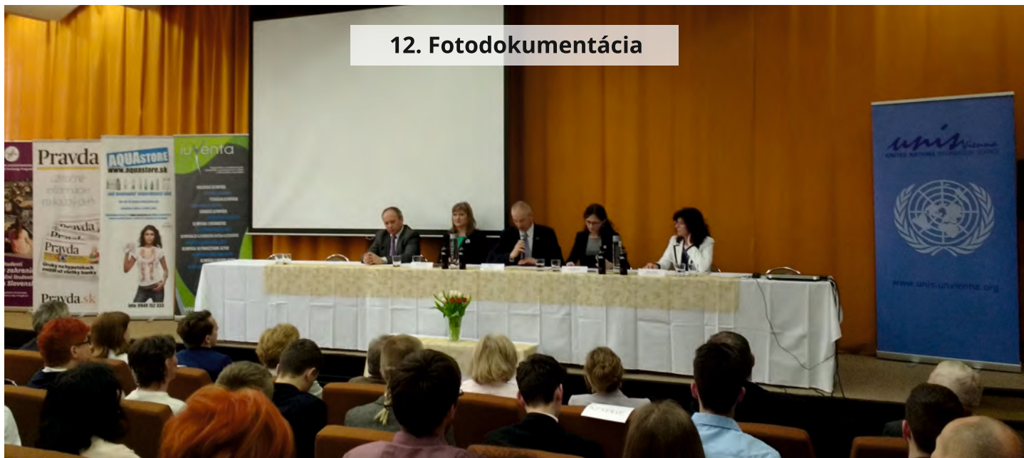
Slávnostné otvorenie celoštátneho kola XIX. ročníka OĽP