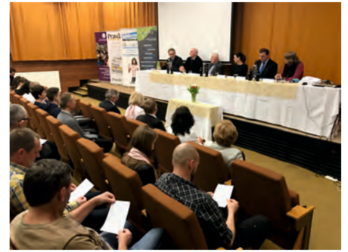
Rozprava k nosnej téme XIX. ročníka OLP