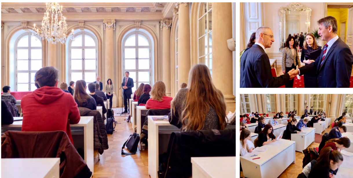
Privítanie hostí a otvorenie krajského kola v Bratislave, súťažiaci pri teste

OÚ odbor školstva Bratislava – ceny, stravné vo výške 330,- €; ostatné darčeky a činnosť poroty sponzorsky poskytnuté.