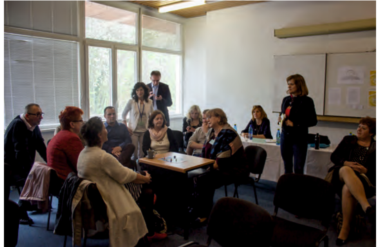
Workshopy partnerských organizácií pre študentov aj učiteľov